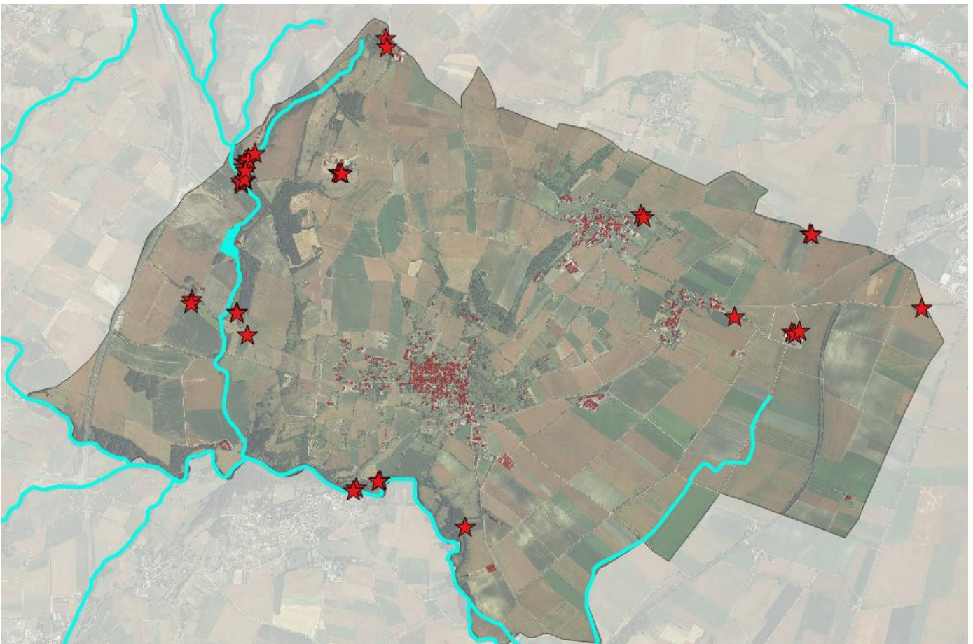
Identification des bâtiments existants pouvant demander l'autorisation de changer de destination.

- Zone naturelle à avis conforme de la CDNPS. La CDNPS devra se prononcer dans un délai de deux mois à compter de la demande d'avis émanant de l'autorité compétente pour délivrer l'autorisation d'urbanisme. Son silence vaudra avis favorable (article R.423-60 du code de l'urbanisme).