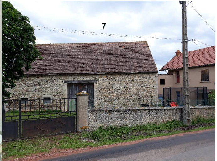
LES BARDONS : YB 55