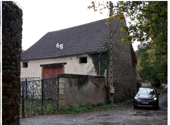
LES BARDONS : YB 32