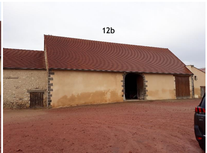
RUE DE RINE : AD 166